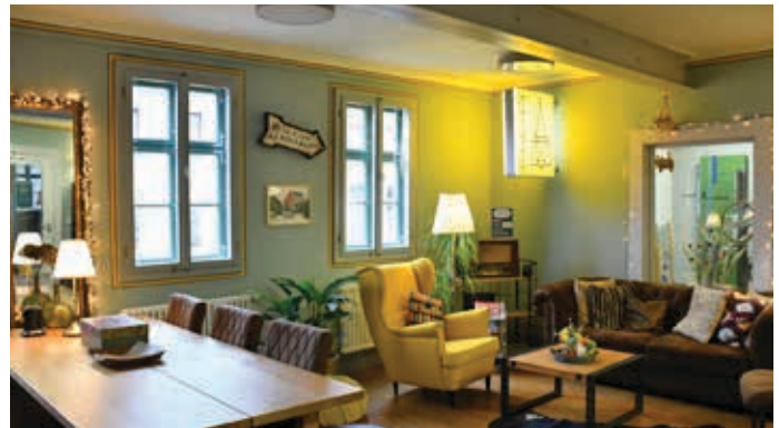
Blick in das gemütlich eingerichtete Lesecafé der Bibliothek.

Pflege nicht mehr weiter tätigen. Ein Umstand, der an so manchem der Vorgärten sichtbar ist.