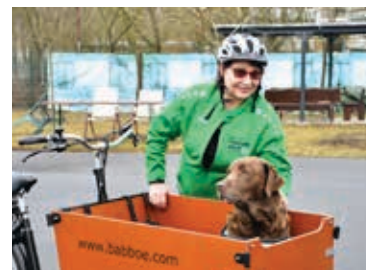
Sogar Vereinshund Charlie durfte eine Runde mit den Lastenrad zurücklegen, sehr zur Freude der anwesenden Kinder.