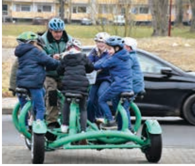
Auch einen Siebensitzer, den man sich beim Verein ausleihen kann, durften die Schüler an diesen Tag testen.

Ein weiteres Highlight war der Mini-Flohmarkt, der vom Fahrradhaus Gräfe, der Stadt Sömmerda und der Kreisverkehrswacht organisiert wurde und sowohl gebrauchte Fahrräder als auch Zubehör zum Verkauf anbot. Das Angebot wurde gut angenommen und fand großen Zuspruch. Auch die Polizei war vor Ort und ermöglichte es den Kindern, im Parcours das Fahrradfahren zu üben – eine wertvolle Vorbereitung für die zukünftige Fahrradprüfung. Der Aktionstag wurde zudem vom