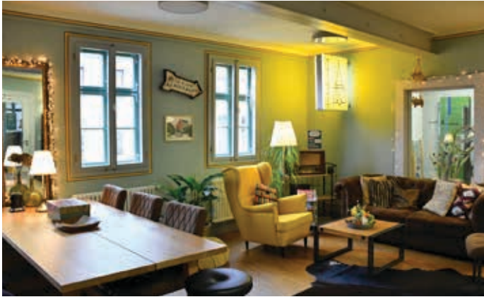
Blick in das gemütlich eingerichtete Lesecafé der Bibliothek.