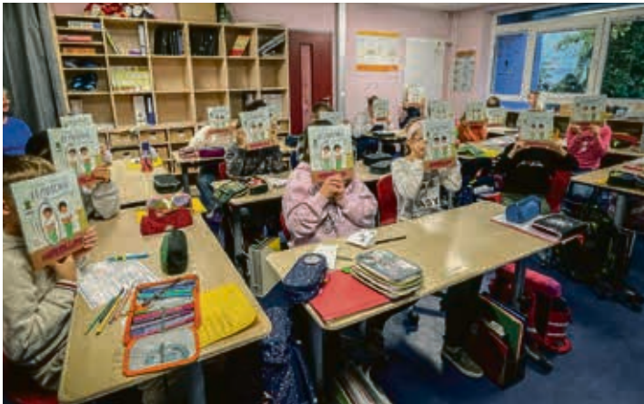
„Flauschig Mauschig“ hieß es für die Sterne und Planeten.

Projekt „Vorlesezeit“ – Wir begeistern Kinder für das Lesen