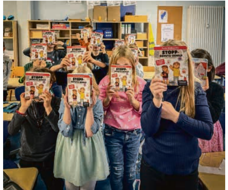
Das Buch „Stopp-Schutzschild“ wurde von den Sonnen und Kometen gelesen.