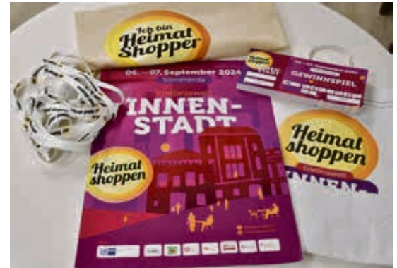
Für die sichtbare Werbung fürs diesjährige Heimat shoppen gibt es unter anderem Plakate, Flyer, Tüten und Schlüsselbänder. Auch die Gewinnspielkarten sind bereits gedruckt.

traktive Preise, die Händlerinnen und Händler bereitstellen, auf die Gewinnerinnen und Gewinner warten.