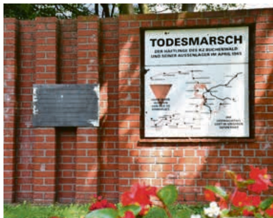
Die Schäden an den beiden Tafeln der „Todesmarschstele“ sind deutlich zu erkennen und sollen behoben werden.

Darüber hinaus ist zum Bauernmarkt für ein abwechslungsreiches Pro-