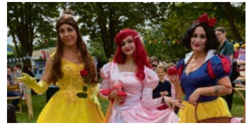
Bereits vergangenes Jahr zogen diese Walking Acts die Blicke und das Interesse auf sich.

Wie wäre es, Märchen- oder Comic-Figuren live zu begegnen? Im Märchengarten im Bürgerzentrum ist das möglich. Seid gespannt, wer sich diesmal unter die kleinen und großen Besucher des Märchengartens mischt und sicher für Aufmerksamkeit sorgt.