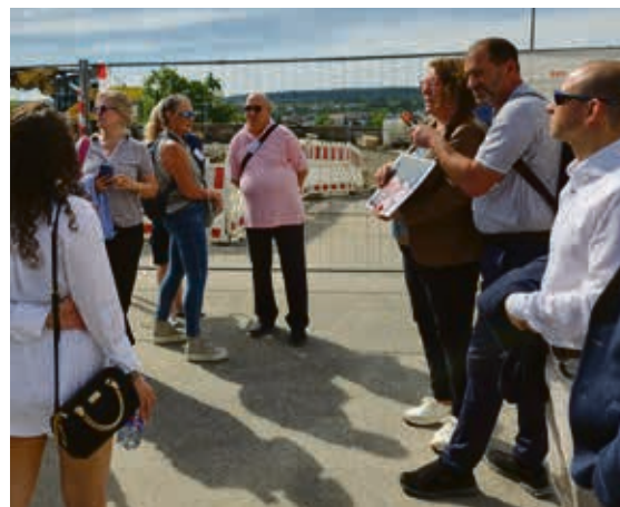
Bürgermeisterin Christine Kraayvanger füllte wiederum mit großem Engagement den Part Stadtrundgang aus, bei dem sie einen Schwerpunkt auf den Schlossberg als eine der Stationen legte.

Ein weiteres wichtiges Thema in Böblingen ist unter anderem auch die Bebauung des Schloßberges. Für diesen gibt es Planungen für den Neubau einer Musik- und Kunstschule mit Räumen für Gastronomie, Vereine und Veranstaltungen sowie Freiräumen mit Blick über die Stadt. Auf dem Schloßberg derzeit archäologische Ausgrabungen. Aus diesen