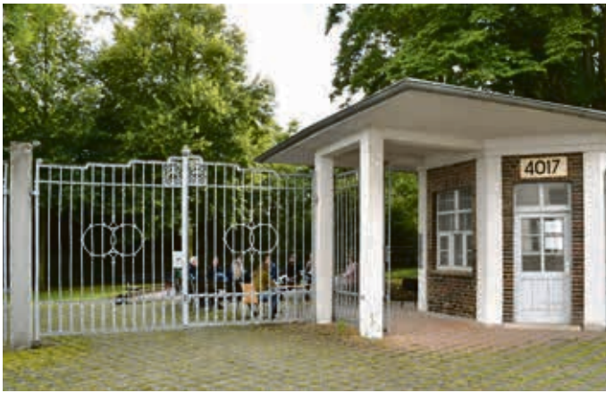
Die Projektgruppe tagte bei ihrer vergangenen Sitzung zum Teil auch direkt am Torhaus 8, dem künftigen Ort der Namen.

Auch Podcasts für den Ort der Namen werden erarbeitet