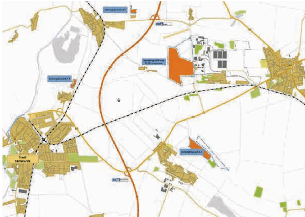
Übersichtskarte: Geltungsbereiche - Bebauungsplan Nr. 17 Industriegebiet „IG-3“ Sömmerda/Kölleda

Es wird gebeten, die Mitarbeiterinnen und Mitarbeiter der vom TLUBN be-